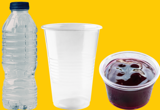
Emballages en plastique