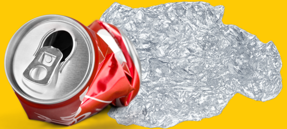
Canettes et papiers en aluminium