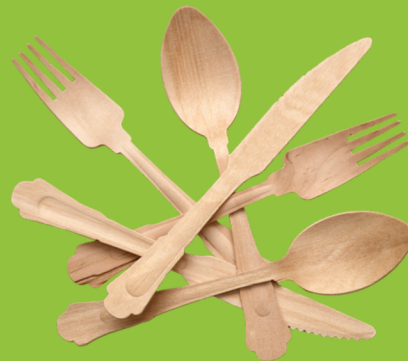
Couverts en bois