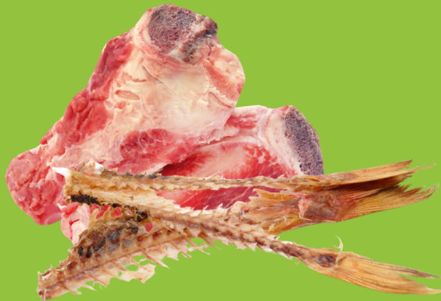
Restes de viande et de poisson