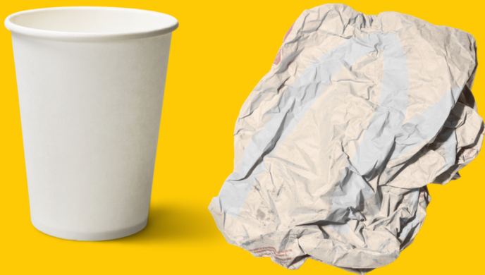
Emballages en papier et carton