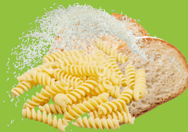
Restes de pain, riz, pâtes...