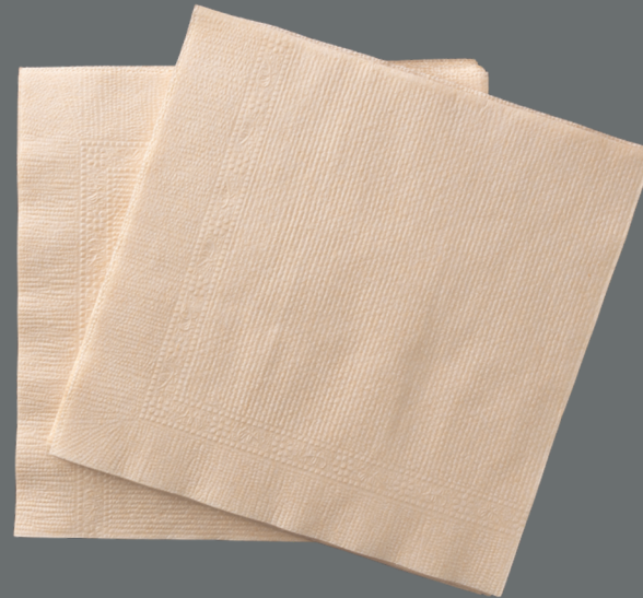
Serviettes et mouchoirs en papier