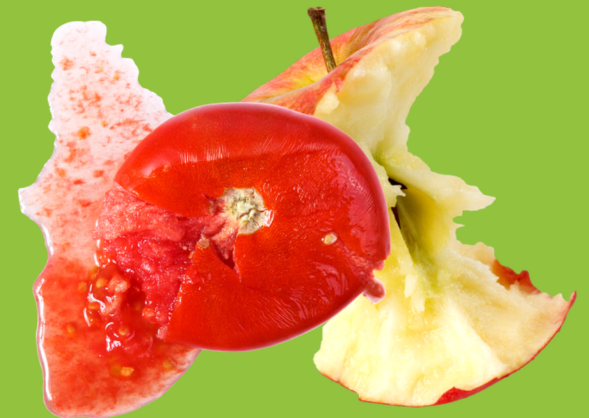
Restes de fruit et de légume